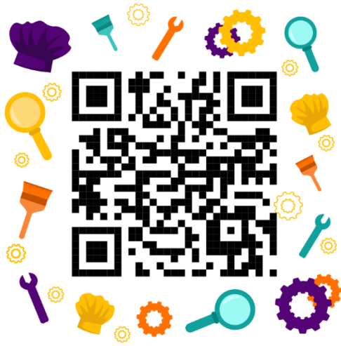
คู่มือการใช้แก๊ส