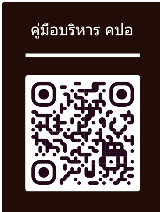
คู่มือการจัดการความปลอดภัย

๑) มหาวิทยาลัยสวนดุสิต ได้จัดทำคู่มือการบริหารจัดการความปลอดภัยอาชีวอนามัยและสภาพแวดล้อมในการทำงาน และ คู่มือระบบการจัดการความปลอดภัย เพื่อเป็นแนวทางเพื่อให้บุคลากรของมหาวิทยาลัยสวนดุสิต ศูนย์การศึกษา หัวหิน ทุกคนได้ปฏิบัติงานอย่างปลอดภัย